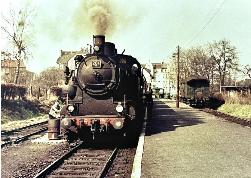
- Unser Familienausflug führte, ...

Der zusätzliche Luftkessel auf der "Lokführerseite" war nach Verschrottung der KN-Loks 201 - 203 Anfang der 1960er Jahre ein Alleinstellungsmerkmal der "204" und ist ebenfalls im Gemälde richtig dargestellt. Von der Lok "204 KN" selbst liegen mir nur 2 Aufnahmen (leider einmal von der "falschen" Seite aus) durch meinen Vater vor, die Ende Februar 1966 kurz vor Abgabe der Lok nach Butzbach entstanden sind: